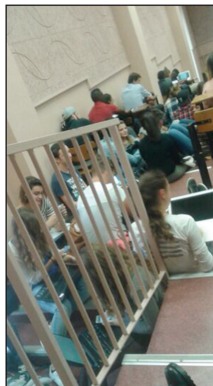
Un amphi à Lyon, en 2015.

Dans l'enseignement supérieur, la situation n'est pas plus reluisante. Malgré le recours massif à des emplois précaires, le nombre de postes reste largement insuffisant tout comme les dotations de l'État à des universités qui gèrent elles-mêmes leur masse salariale suite à la loi LRU de destruction de l'Université de 2007. Conséquence la plus spectaculaire : amphes et TD pleins à craquer, étudiants et étudiantes assis.e.s par terre, mais aussi une sélection à l'entrée des formations qui tend à se généraliser.